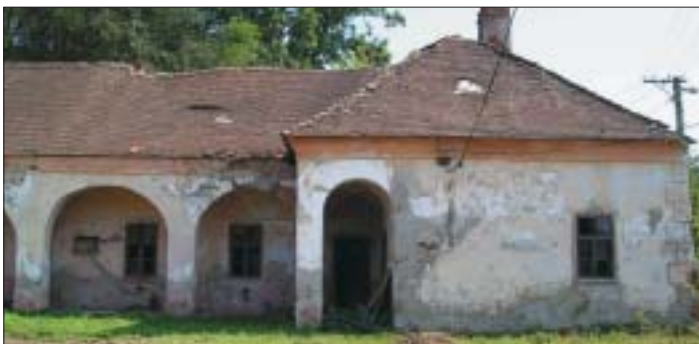
Medzi najstaršie historické pamiatky Krásnej patrí kúria na Opátskej ulici. Z jej rekonštrukciu začal nový vlastník v poslednom štvrtroku 2007.