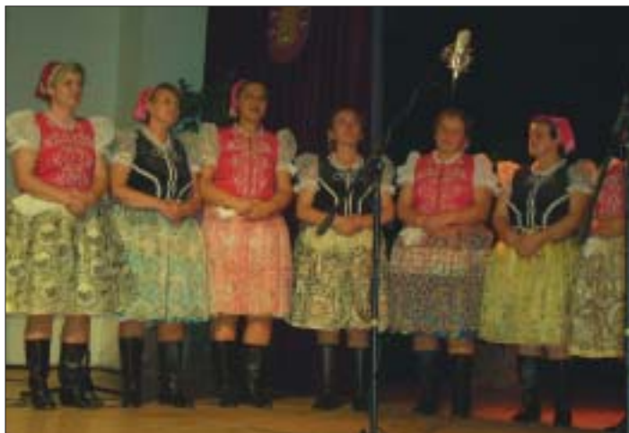
Vítazi tohtoročnej spevackej súťaže „Na košickej turni“, ženská časť Dedinskej spevackej skupiny KRASNANKA.