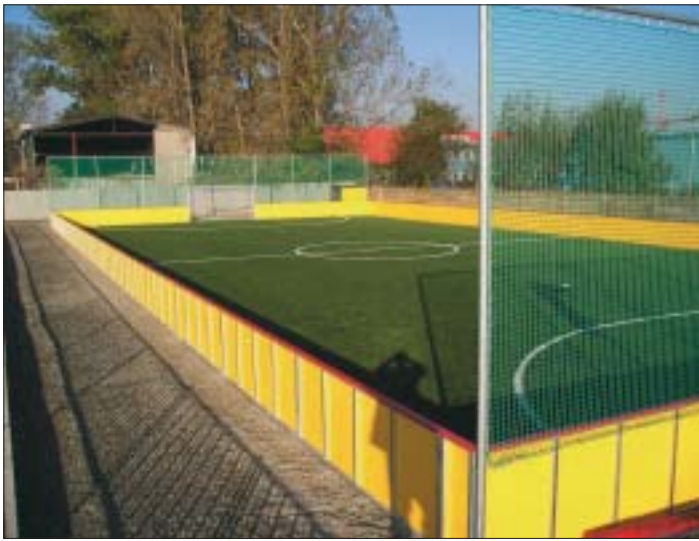
Pohľad na novoukončené futbalové ihrisko s umelou trávou o rozmeroch 40 m x 20 m, ktoré bolo odovzdané do užívania v septembri 2007.