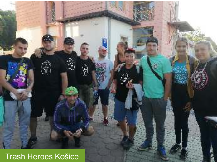
Trash Heroes Košice