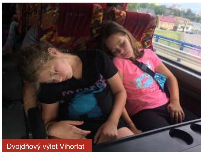
Dvojdňový výlet Vihorlat