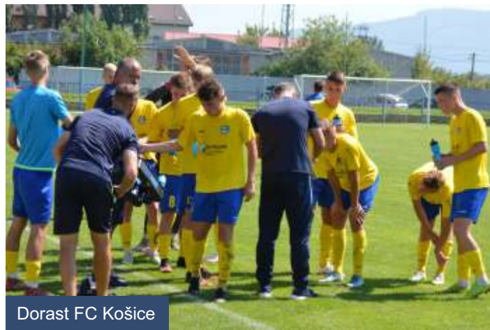
Dorast FC Košice