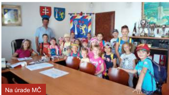
Na úrade MČ