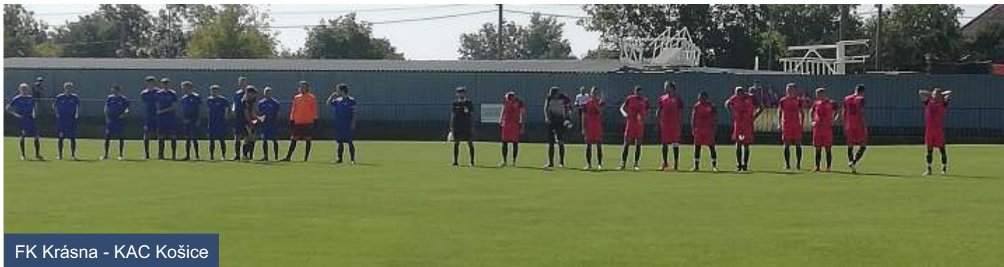
FK Krásna - KAC Košice