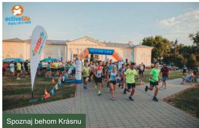
Spoznaj behom Krásnu