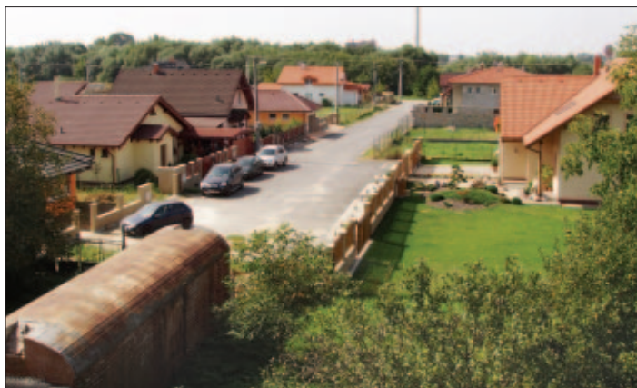
Pohľad na Tatarkovu ulicu z Ormej, o ktorej v ankete s novými obyvateľmi Krásnej píšeme na 9. strane.

Skutočnosť, že cesta je otvorená, prináša so sebou aj povinnosti: postaviť oplotenie, nahlásiť KOSITU zmenu zberného miesta kukanádoby, tiež nahlásiť na pošte zmenu poštovej schránky, ktorú je potrebné umiestniť na hranicu komunikácie a súkromného pozemku. Peter Fedor