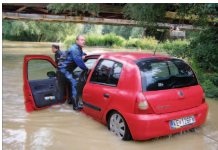
Aj takéto dramatické situácie sa udiali počas tohtoročnej povodne na Hornáde, 26. júla 2008 pod železničným mostom.

Váš Otec Karol, biskup Jágerský. Pripravila: Anabela Obyšvská