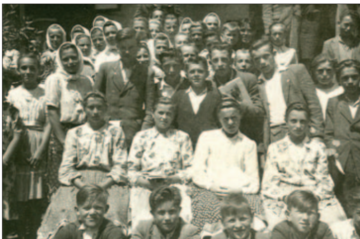
Rozlúčka so školou po ukončení deviateho ročníka pred päťdesiatimi rokmi na nádvorí strednej školy – kaštieľ, ktorý v súčasnosti čaká na svoju renováciu.