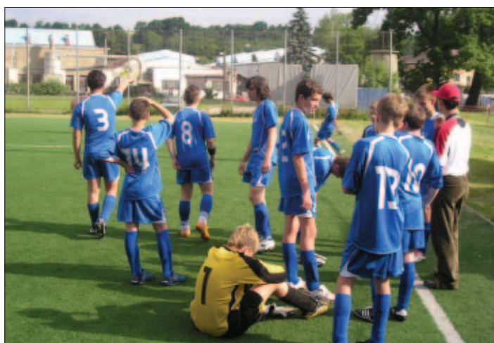
Žiaci nášho FK na medzinárodnom turnaji v partnerskej obci Mikulovice v ČR, kde hrali zápas so žiakmi Sparta Praha.