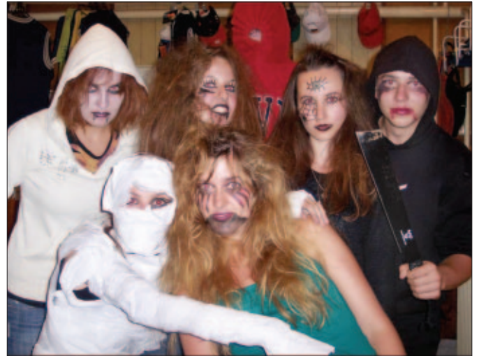
Animátori pripravení na nočnú hru pri chate Lajoška

V stredu sa začína deň rozcvičkou, umyjeme sa, zbalíme si veci a potom nasledujú raňajky. Síl máme dosť a tak sa púšťame do súťaží družstiev. Naobedujeme sa, rozdáme si zaslúžené ceny a utekáme na autobus. Cestou v autobuse nás už nejedného ťahalo spať 😊.