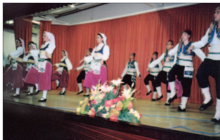
Umenie a kultúra dokážu človeka duševne obohatiť a na chvíľu ho lahodnou hudbou, spevom a vo víre tanca preniesť do krajín blízkych, ale aj veľmi vzdialených. Tak sme to preživali aj pri svojiských rytmoch tanečníkov z Turecka.