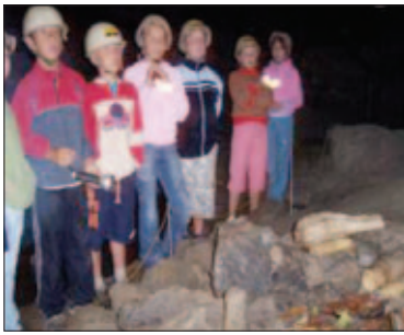
V jaskyni Zlá diera

V pondelok ráno cestujeme autobusom do dedinky Lipovce, odkiaľ sa po vlastných nohách vydávame na cestu Lačnovským kaňonom až k samotnej jaskyni Zlá diera. Cestou nás sprevádza potok a množstvo milých kaskád. Pri jaskyni sa delíme na dve skupiny a kým si prvá prezerá jaskyňu, druhá už zbiera drevo na oheň, na ktorom si opečieme dobroty. Po tme, len s karbitkami či baterkami v ruke a s prilbou na hlave prechádzame jaskyňou. Zoznamujeme sa s Bielou pani, psom Falcom, či päťhlavým drakom. Niektorí z nás sa prechodom cez „Pôrodnú dieru“ dokonca i druhýkrát narodí! 😊 Po namáhavom výstupe z jaskyne sa pred cestou domov ešte posilníme opečenými špekáčkami.