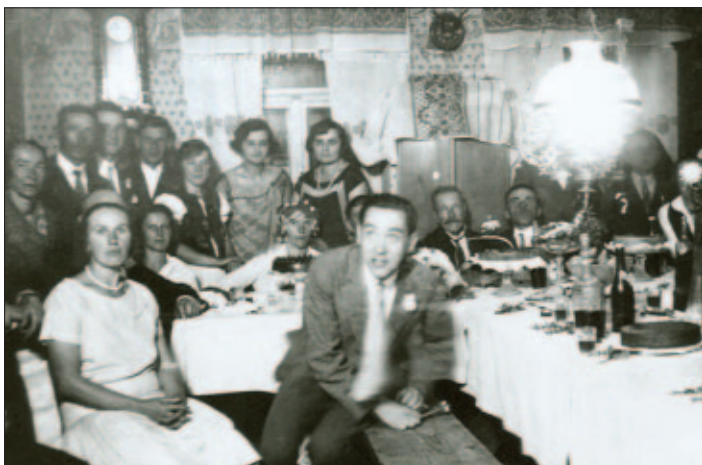
A takto vyzerala svadobná hostina, údajne v Bialkovom rodinnom dome, na dnešnej Ukrajinskej ulici, vtedy to bolo na „Svitaji“.