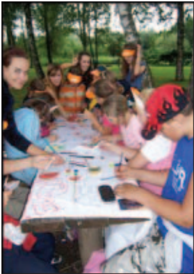
Maľovanie táborovej vlajky

V prvý táborový týždeň nám počasie neprialo, preto sme boli nútení náš program troška pozmeniť.