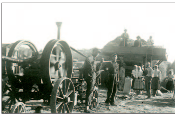
Možno skôr narodeným čosi napovie aj takto zubom času poznačený záber, ktorý napovedá ako sa za starých čias mlátilo obilie.

Texty k fotografiám z vašich albumov napísal a ďakuje: šéfredaktor