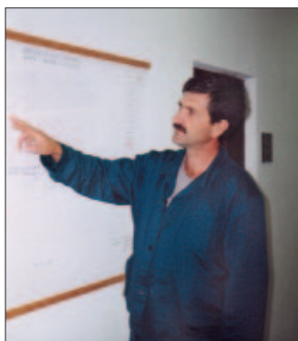
M. Cúr sa z času na čas musí pozrieť aj na Orientačný plán cintorína na miestnom úrade

betónu a iné. Problém je potom pri ich vyprázdňovaní a vysypávaní do kontajnera, čo je fyzicky často nezvládnuteľné, k čomu si musím prizývať pomocníkov. Pokiaľ ide o kosenie, mojou povinnosťou nie je kosiť hroby iba uličky medzi nimi. To sa ani nedá i keby som chcel, keď sú tam kahance, kvetináče... Myslím si, že každý pozostalý by sa mal postarať o zbavenie trávy a buriny na hroboch svojich príbuzných. A ešte. Ak niekto mení staré pomníky za nové, staré by mal zlikvidovať mimo objektu cintorína (zberný dvor, Environcentrum a pod.), nie však do okolia cintorína. Rovnako aj zvyšky betónu, či cementu z hlavnej cesty, kde robia betónovú zmes. Všetko je