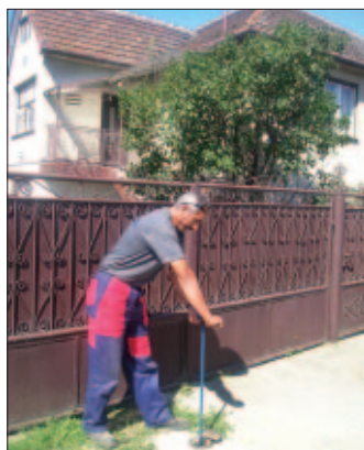
Pracovník VVS pri otváraní kanalizačnej prípojky

Napriek smelým plánom začať s výstavbou komunitného parku a s rekonštrukciou námestia v Krásnej, tohto roku sa nám to už nepodarí. Prečo? Hlavným dôvodom je nedostatok finančných zdrojov na pokrytie celej stavby. Podstat-