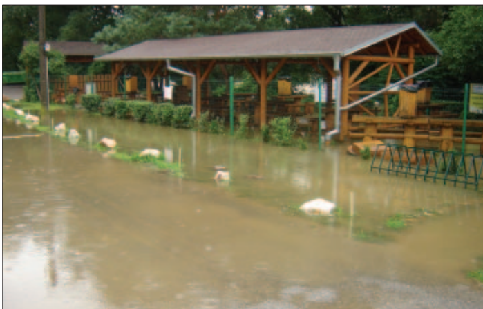
Tohtoročná povodeň na Hornáde po prvýkrát zasiahla aj Letnú záhradu na ulici 1. mája (viac na strane 8).