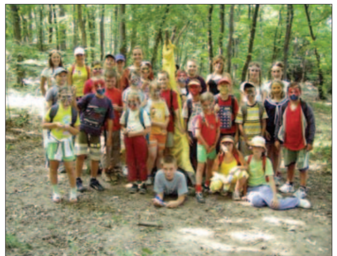
Fotografia indiánskych kmeňov

V piatok začíname deň pre nás už tradičnou zoznamovacou hrou, po skončení ktorej trielime do lesa.