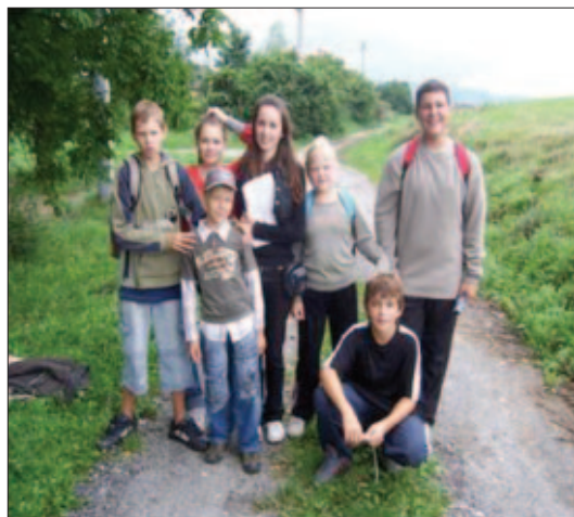
Putovanie za pirátskym pokladom

V piatok sa už len ôsmi odvážlivci stretávame na zastávke a tak výlet na hrad v Starej Ľubovni pre zlú povodňovú situáciu prekladáme na prvý augustový týždeň. Počkať si na tento výlet však stojí za to. Ráno sa v hojnom počte stretávame na zastávke za nádherného slnečného počasia. Cesta autobusom je síce trocha dlhšia, ale spestrujeme si ju hrou na gitaru, spevom a niektorí aj hraním kariet. Najprv si prezeráme skanzen, potom si ideme pozrieť divadelné predstavenie o ľubovnianskej hradnej pani, neskôr sa prechádzame hradom za výkladu našej sprievodkyne a na záver si ideme ešte prezrieť stredoveký vojenský tábor, v ktorom nás čaká ďalšie divadelné predstavenie. To je veru poriadne nabitý program, ale všetko si v pokoji vychutnávame. ☺ Dokonca máme čas zahrať si aj stredoveký tenis a popreháňať sa choduliach.