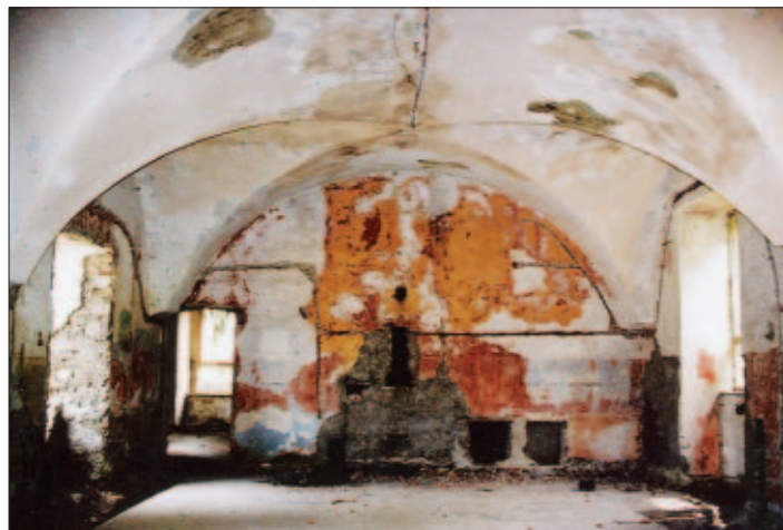
Žiaľ, takto vyzerá v súčasnosti zubom času ohlodaný interiér kaštiela, ktorý čaká na svoju obnovu aj za vašej pomoci.