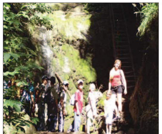
Cesta Lačnovským kaňonom

Počas druhého týždňa akcií sme mali nádherné slnečné dni a tak sme mohli uskutočniť takmer všetky plánované výlety bez zmien.