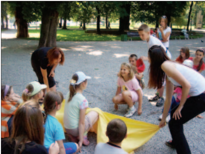
Zoznamovacia hra pred cestou na Lajošku

V utorok sa nedečkávi, v hojnej prevahe dievčat, vyberáme na dvojdnový výlet do Volovských vrchov. Výstup na chatu Lajoška je však namáhavý, ale po chvíľke výdatného odpočinku na izbách, sa ešte nájde nejaký ten zvyšok energie na zahratie hry Hutututu a na večernú opekačku. Čo by to však bol za dvojdnový výlet, keby chýbala diskotéka? O desiatej na nás dolieha únava a tak sa obliekame do pyžám a ukladáme spať. O polnoci sa však z lesa ozývajú strašné zvuky. Prekvapenie! Začala sa nočná hra. Čo sa ale v lese udialo, to ostane medzi nami. Môžem vás však ubezpečiť, že v tábore sme všetci odvážni. 😊