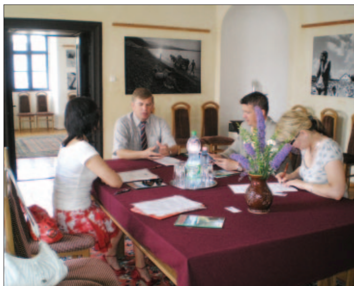
Predčasom partnerskú spoluprácu nadviazali starostovia Krásnej a maďarskej obce Hidvegardó s cieľom zachrániť kaštieľ v Krásnej. Náš záber je z rokovania a podpísania zmluvy v Maďarsku.