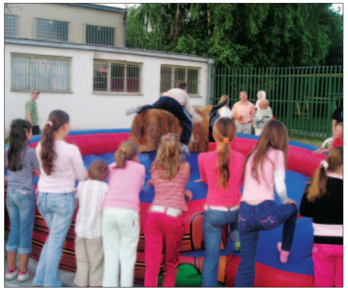
Súčasťou osláv Dňa Krásnej bola aj jazda na elektrickom býkovi, ktorá sa tešila veľkej pozornosti najmä tínedžerov.

Ďalším z nárokov pre pozostaleho, ktorý zabezpečuje pohreb je príspevok na pohreb, kde podmienkou je už spomínané zabezpečenie pohrebu. Pozostalý ako aj zomrelý (v čase smrti) musí mať trvalý alebo prechodný pobyt na území SR. Dávku vypláca úrad práce, sociálnych vecí a rodiny príslušný podľa miesta trvalého alebo prechodného poby-