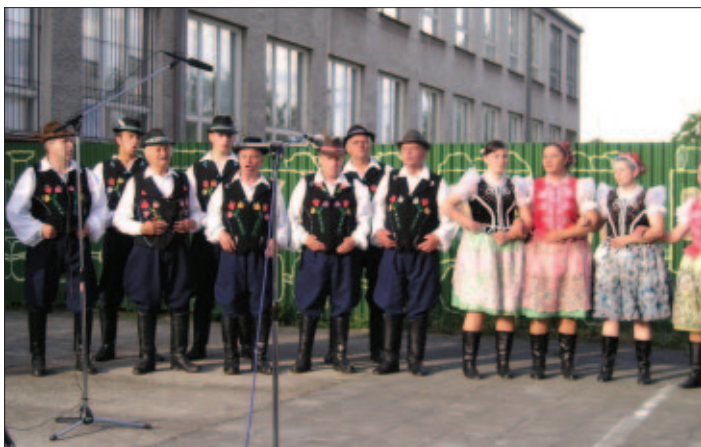
Ako vždy, úvod každej oslavy v Krásnej začína náš Folklórny súbor Krasňanka. Tentoraz ho vidíme počas vystúpenia na nádvorí školy.