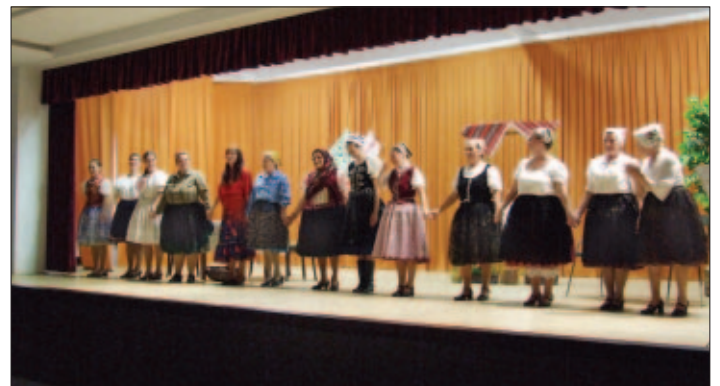
Členovia pätnásťčlenného novovzniknutého divadelného súboru „Krasňančan“ pri úvodnej, ale aj záverečnej piesni Co še stalo v tym Siplaku noveho...

Husto začalo byť koncom mája, keď sa blížila naša veľká premiéra. Myslím, že až vtedy si väčšina z nás uvedomila na čo sme sa to vlastne dali. Začali sme zabúdať dávno naučené texty, a musím prezradiť, že niektorí mali aj zajačie úmysly. Viete si predstaviť, akú radosť