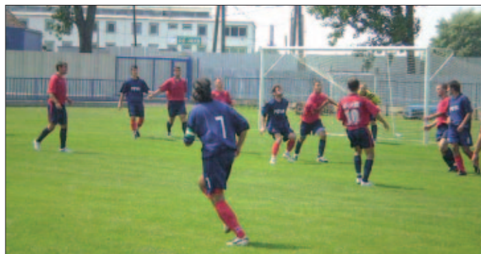
Z futbalového zápasu MFK Košice-Krásna a FK Topoľany (1 : 0)