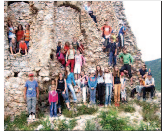
Na Turnianskom hrade

V utorok ráno nás hrejivo víta slniečko, preto nezháľame a už sedíme vo vláčiku, ktorý nás odvezie až do Turne nad Bodvou. Nejedného odvážlivca vydesil pohľad na kopec, na ktorom sa vypína Turniansky hrad, ale cestu zvládame ľavou – zadnou. Trošku sa ešte pokocháme nádherným výhľadom a vydávame sa ďalej do malej dedinky Háj, pozrieť sa na obrovskú sochu anjela bez krídla. Pre mraky, ktoré nám hromžia nad hlavami však od cesty k Hájskym vodopádom musíme upustiť. Na spiatocnej ceste vlakom nás unavených uspáva tichý dažďik.