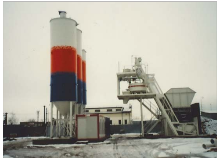
Pod rukami zručných stavbárov a montážnikov vyrastá ďalšia dominanta v Krásnej – moderná betonáreň, ktorej kapacita je päťdesiat kubických metrov zmesi za hodinu.

referáte výstavby a životného prostredia, telefónna linka 6852 182 bude nedostupná. Preto využite „horúcu“ linku s odkazovačom. I keď si neželáme, aby bolo veľa hlásení o poruchách rôzneho charakteru, no ak sa predsa len vyskytnú, našou snahou bude tieto čo najskôr odstrániť. Preto vás žiadame o trepezivosť pri ich riešení. (vas)