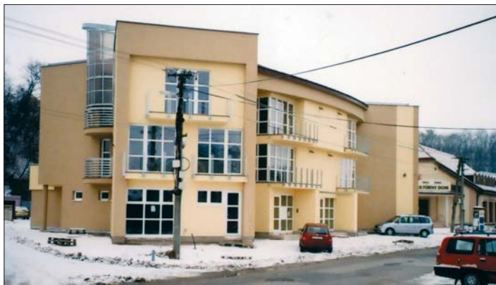
Pohľad na polyfunkčný objekt začiatkom decembra. Budova je zateplená, v zimnom čase prebiehajú ukončovacie práce interiéru a v jari chcú pokračovať na vonkajších úpravách terénu.