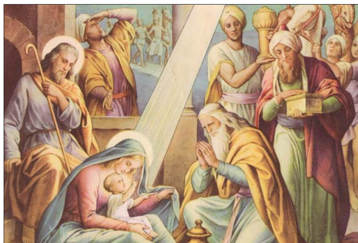
Padli na tvár, klaňali sa mu a podali mu dary: zlato, kadidlo a myrhu.