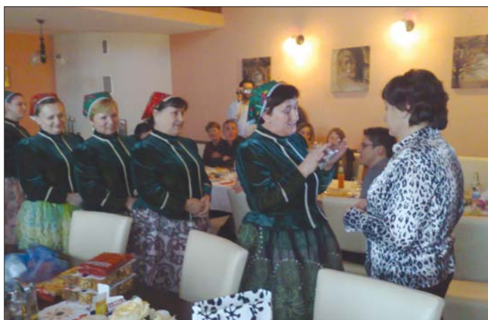
Pri oslave životného jubilea sme zastihli ženičky z Vyšnej Hutky. A takto vyzerá jeden zo slávnostne prestretých jedáľenských stolov pred konzumáciou.