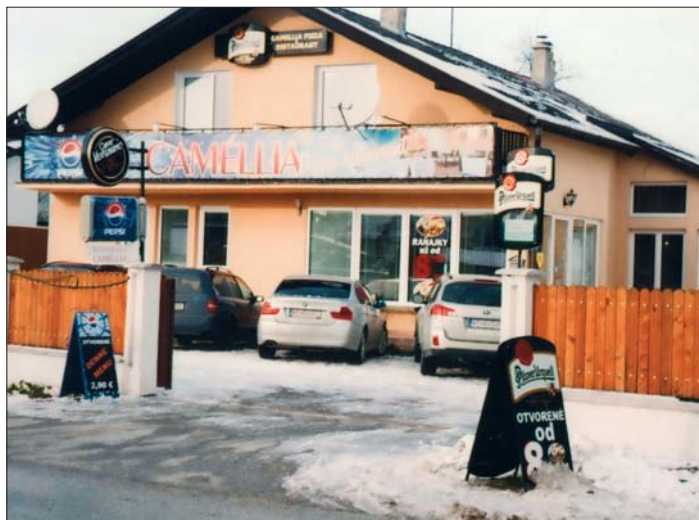
Aktuálny pohľad na reštauračné zariadenie „Camellia“ a jej nádvorie na našej Ukrajinskej ulici číslo 27.

aj na rôzne spoločenské akcie. Cestu k nim nachádzajú oslávenci, jubilanti, konajú sa tu posedenia pri príležitosti krstín, stužkové slávnosti, ale aj kary a iné podujatia. Čím to je, že ich