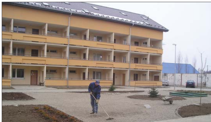
Takto vyzerajú konečné terénne úpravy parkovej zelene pred obytným súborom bytových domov na Golianovej ulici 30 až 33 o ktorom píšeme na 8. strane.

• Kto sa snaží dosiahnuť veľký cieľ, nesmie myslieť na seba.