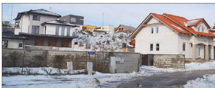
Pohľad na Šuhajovu ulicu, o ktorej je reč v miniankete.

● Aké sú vaše prvotné pocity a dojmy z bývania?