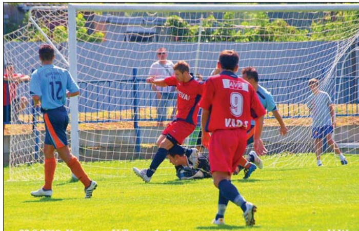
Zo zápasu Krásna – Vysoké Tatry 1 : 1.