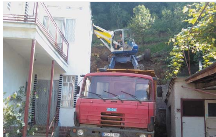
Zosuvy pôdy na ulici 1. mája

• Nešťastie je skúšobným kameňom charakteru.