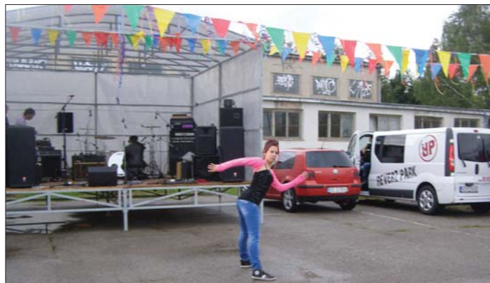
Areál školy je často miestom rôznych školských i mimoškolských kultúrno-spoločenských podujatí. Naposledy pri oslavách „Dňa Krásnej“ sa tu hip-hopom prezentovala aj mladá tanečnica.

• Deľme sa o lásku, nádeje a sny, o svoj čas, myšlienky, zážitky a skúsenosti.