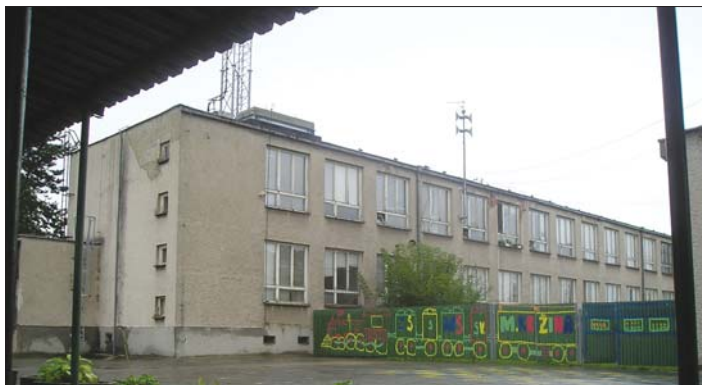
Naša škola ešte v čase, keď na nádvorí, chodbách a v učebniach chýbal ruch, hluk, smiech žiakov a ich učiteľov.

Po dvojmesačnej odmlke, priestory našej školy, – ktoré dosiaľ živali prázdnotou – sa opäť zaplnili žiakmi. Najmenšími, prváčikmi, ktorí po prvý raz prekročili jej brány až po tinedžerov, ktorí sa čo nevidieť rozlúčia so svojimi učiteľmi a žiakmi nižších ročníkov, aby pokračovali v ďalšom vzdelávaní. Nečudo, že nádvorie, chodby a triedy sú plné džavotu a vravy, tiež očakávania, čo im prinesú nastávajúce dni v školských laviciach aj mimo nich.