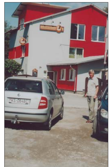
Súčasný pohľad na zrekonštruovaný „Motorest pri starom mlyne“. Po vkusne vybavenom interiéru – o ktorom sme písali v prvom tohtoročnom čísle Krasňančana – nový šat dali Farkašovci aj exteriéru. Náš záber je z parkoviska, ktoré zriedka víva prázdnotou.

• Rodičia môžu dať svojim deťom všetko, okrem šťastia.