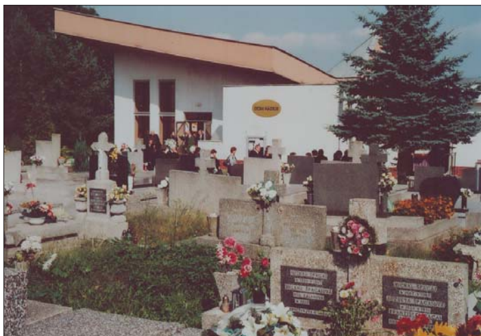
Pohľad na časť našich budúcich „príbytkov“, kde sa chystáme až nám prestanú platiť „víza“ na matičke Zemi. V pozadí náš „Dom nádeje“.