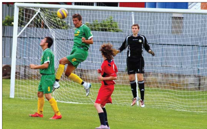
Momentka z futbalového duela Krásna - Snina 2 : 0.

V prvom jarnom kole sme doma hostili v derby zápase Vyšné Opátske. Výkon oboch mužstiev v tomto zápase zodpovedal úrovni začínajúcej sezóny po dlhšej zimnej prestávke. Hra bola vyrovnaná, dostali sme sa aj do vedenia, avšak šťastie nám nakoniec neprialo, keď hostia v samom závere otočili výsledok na 1:2. Na druhý zápas v Stropkove mužstvo