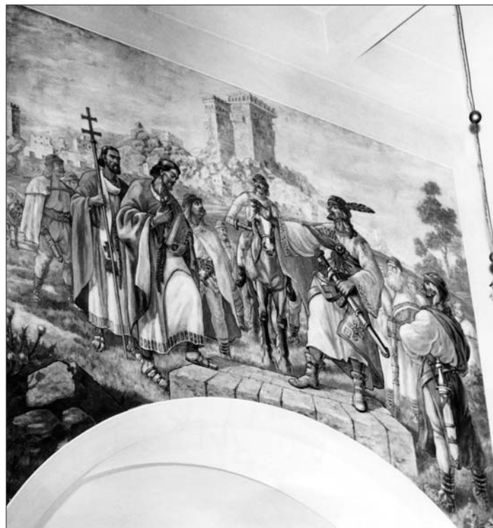
Nástenné malby nášho kostola sv. Cyrila a Metoda vytvárajú nezapomeniteľnú atmosféru pre všetkých, ktorí doň prichádzajú. (bič)