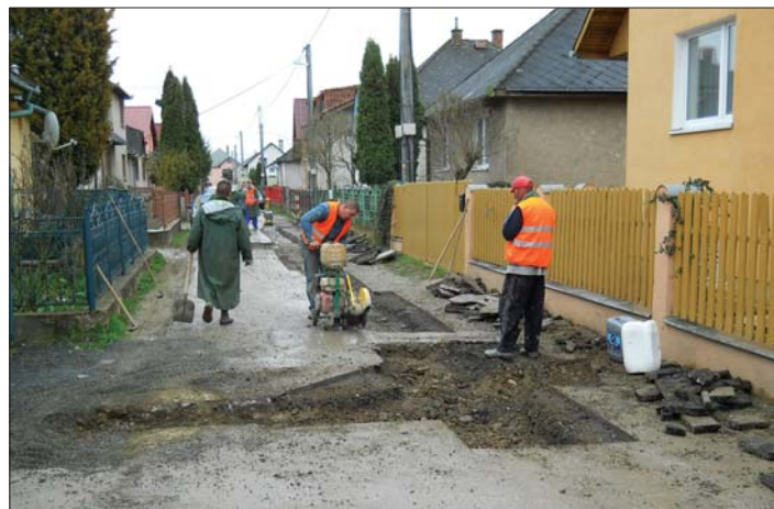
Posledné úpravy pri ukončovaní povrchových úprav tlakovej kanalizácie, na Goetheho ulici. Na fotografii pracovníci firmy Spojstav Košice.