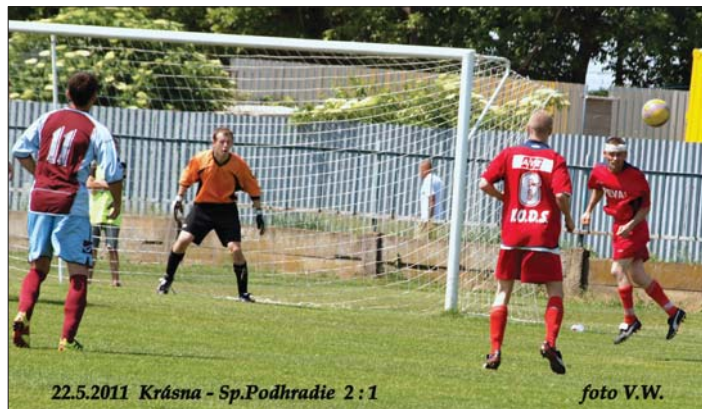
22.5.2011 Krásna - Sp.Podhradie 2 : 1

V nasledujúcom zápase s Topolanmi bol imperatív jasný - konečne naplno bodovať. V prvom polčase sme boli lepším mužstvom a otvorili sme aj skóre zápasu. V ďalšom