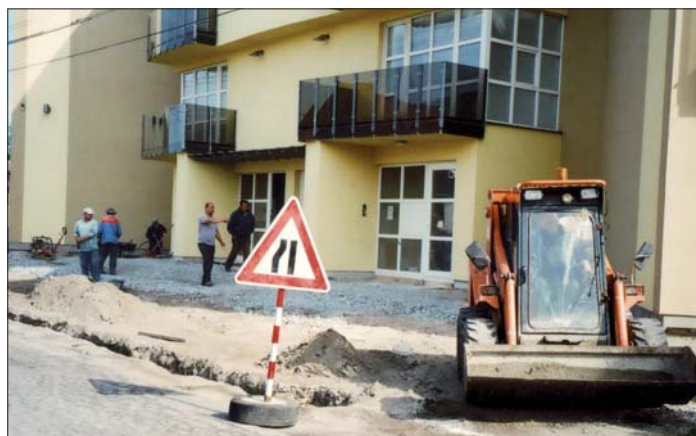
V týchto dňoch čulý pracovný ruch je aj pri polyfunkčnom objekte. Na rade je pokladanie dlažby pre parkovisko a úprava terénu pre zeleň.