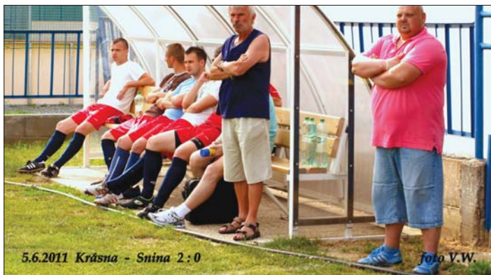
Takto vyzeralo na trénerskej lavičke počas zápasu so Sninou.

vycestovalo so snahou odčiniť domácu stratu. Herná taktika bola postavená na pozornej defenzíve s jednoduchým riešením herných situácií. Nechýbala nám potrebná agresivita a domácim sme boli viac ako vyrovnaným súperom. Nakoniec sme v tomto zápase fahali za kratší koniec, keď po chybe inak vynikajúceho nášho brankára sme pokutovým kopom 10 minút pred koncom prehrali 1:0.