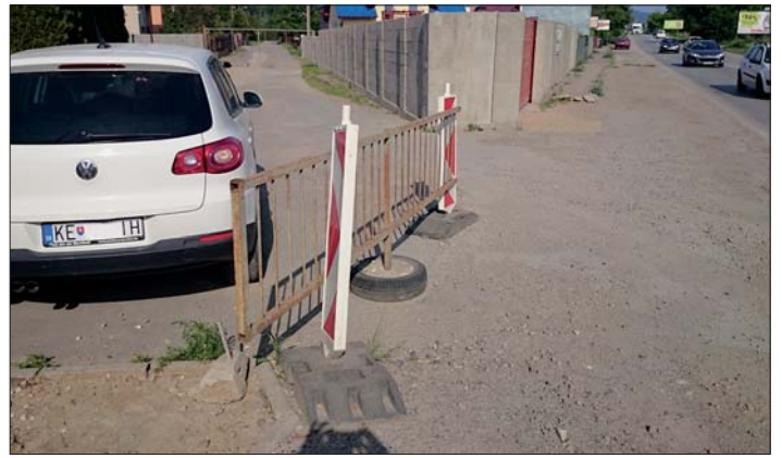
Najskôr garáž, potom plot. Takto vyzerala ulica s oplotením. Obyvatelia Keldišovej ulice museli prechádzať takmer dvadsať rokov po Golianovej ulici.