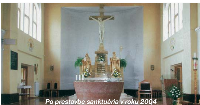
Po prestavbe sanktuária v roku 2004