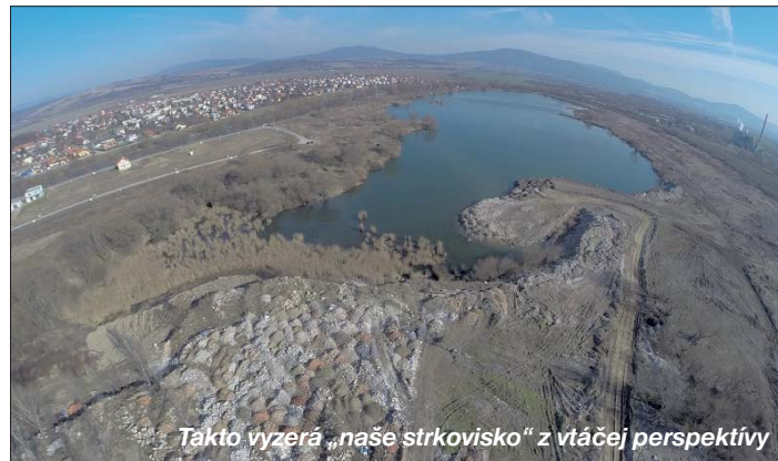
Táto vyzerá „naše štrkovisko“ z vtáčej perspektívy

horšie – nevie kontrolovať nikto. Na stretnutí s aktivistami, ktorí sa venujú ochrane životného prostredia zástupcami