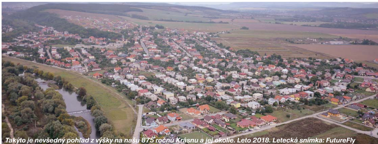
Takýto je nevšedný pohľad z výšky na našu 875 ročnú Krásnu a jej okolie. Leto 2018.