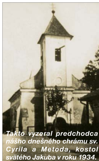
Takto vyzeral predchodca nášho dnešného chrámu sv. Cyrila a Metoda, kostol svätého Jakuba v roku 1934.

A my v našich miestnych novinách chceme tento „klenot“ dávnych časov (život, prácu, kultúru, zvyky a obyčaje) aj touto formou odovzdávať dnešnej i budúcim generáciám, deťom našich detí. (bič)