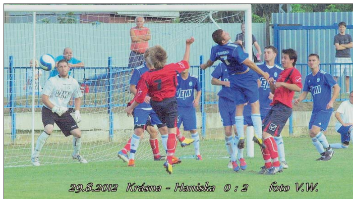
29.8.2012 Krásna - Haniska 0 : 2

Pred začiatkom letnej prípravy na novú súťaž naše mužstvo opustilo viacero hráčov a káder, ktorý zostal bol doplnený mladými hráčmi prevažne z nášho dorastu. Veľké zmeny nastali dva dni pred začiatkom regionálnych súťaží, keď opäť z 2. ligy sa odhlásila aj Moldava, ktorú nahradila Ružina