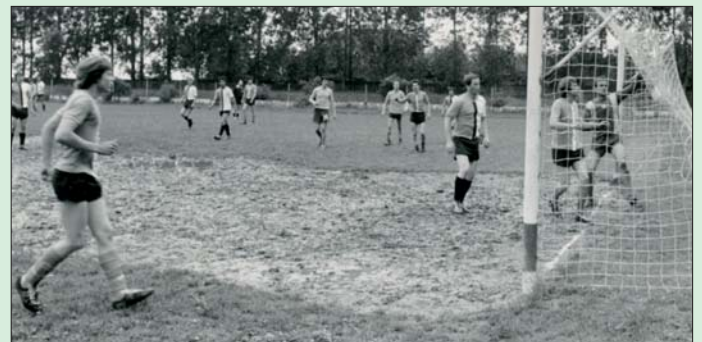
Takto vyzerala hracia plocha v osemdesiatych rokoch.