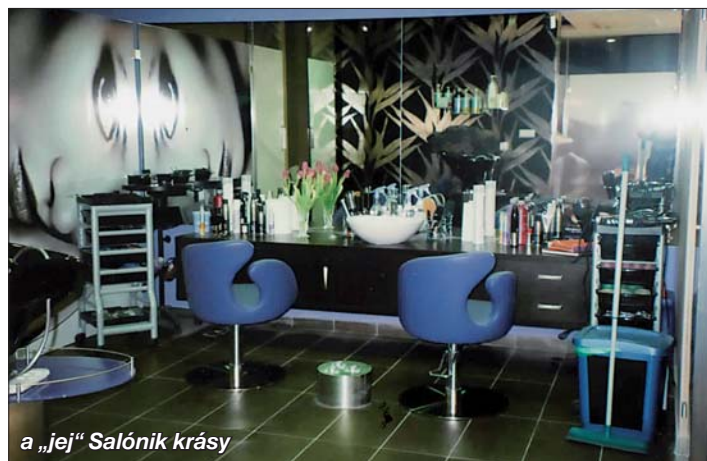
a „je“ Salónik krásy