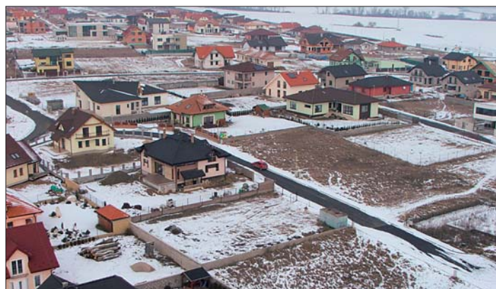
Letecký pohľad na novú stavebnú lokalitu „Na Brehu“.