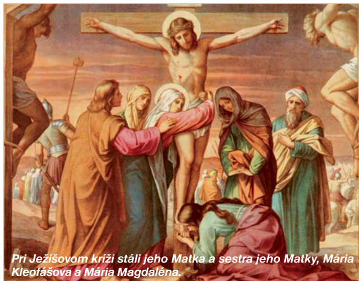
Pri Ježišom križi stáli jeho Matka a sestra jeho Matky, Mária Kleofášova a Mária Magdaléna.

Nezotrúvaj vo vzdore. Nebuď nikomu „na zlosť“. Nič neplánuj len preto, aby si niekomu dokázal, že ti ukrivdil, alebo že sa vo vzťahu k tebe mylil. Nechystaj žiadne akcie, neplánuj nič, aby si dokázal, že niečo znamenáš, že niečo si, že niečo dokážeš. To nie je láska. Nemaj strach, že niekto môže prísť k presvedčeniu, že nie si taký, za akého ťa pokladal. Neži ako uštvaný pes, ktorý stále čaká na ďalší úder. Buď slobodný. Zachovaj si svoju ľudskú dôstoj-