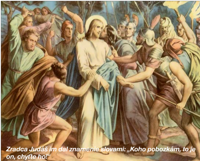
Zradca Judáš im dal znamenie slovami: „Koho pobožkám, to je on, chyďte ho!“